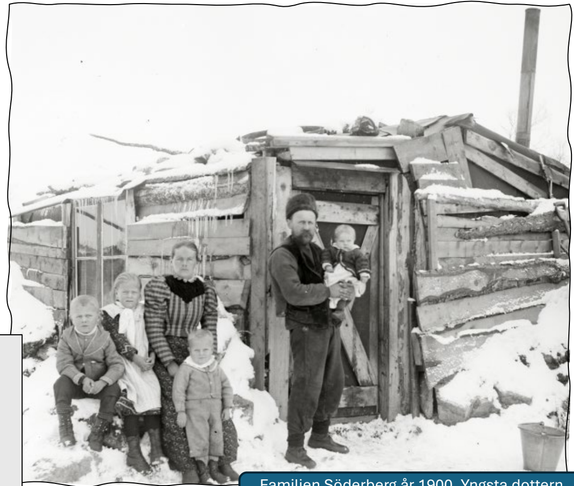
Familjen Söderberg år 1900. Yngsta dottern Kiruna är samhällets förstfödda.