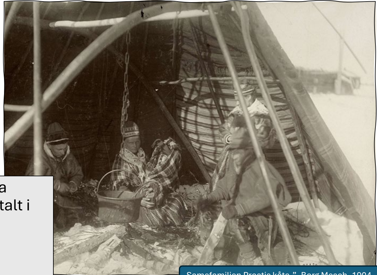
Samefamiljen Prostis kåta.", Borg Mesch, 1904.