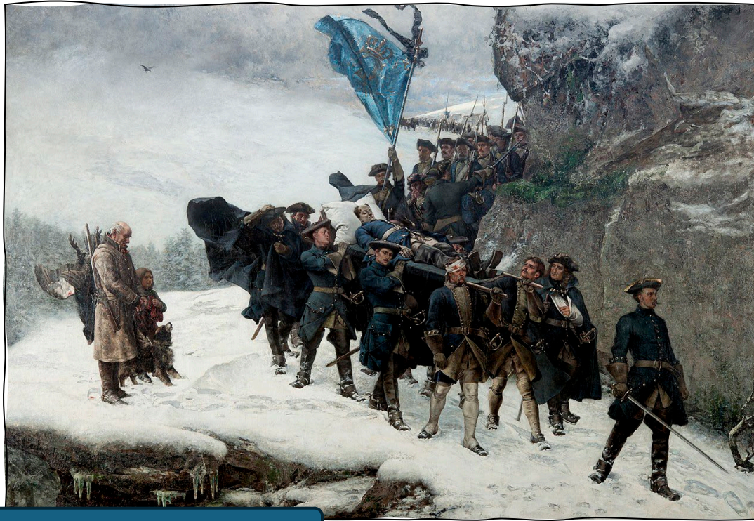
Karl XII:s likfärd, Gustaf Cederström, 1878.