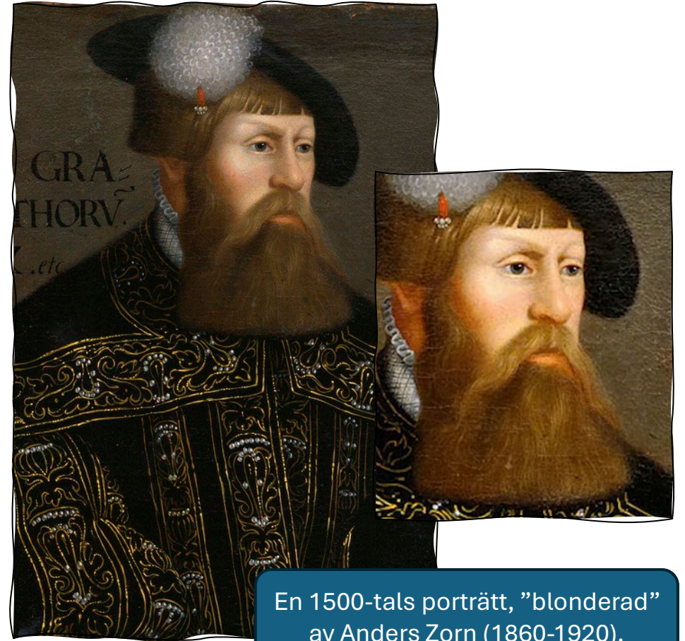
En 1500-tals porträtt, "blonderad" av Anders Zorn (1860-1920).