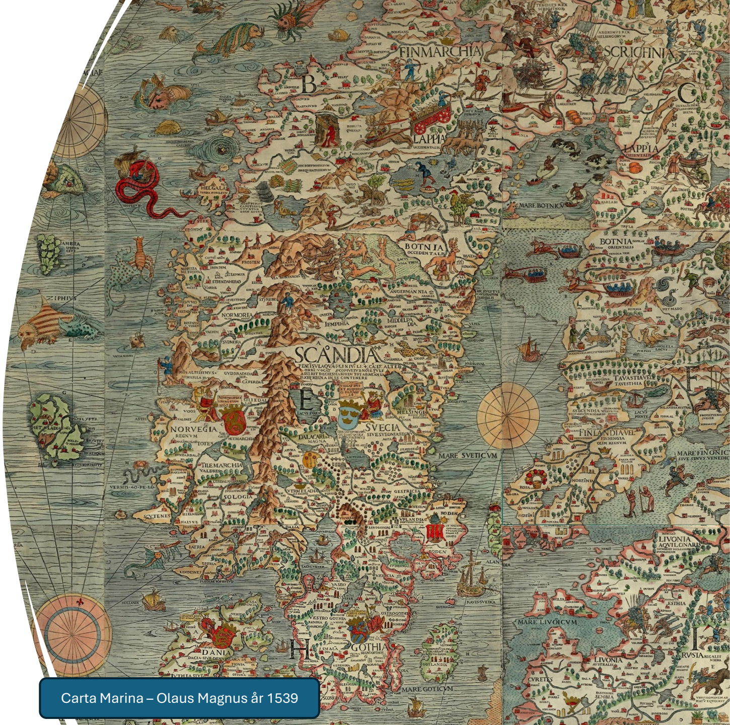
Carta Marina – Olaus Magnus år 1539